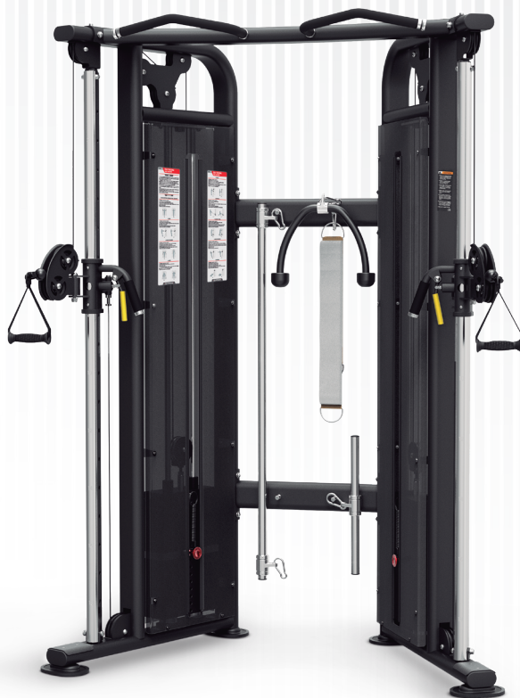
PC0921-OPT Brazo regulable (pieza opcional) Adjustable arm (optional part)